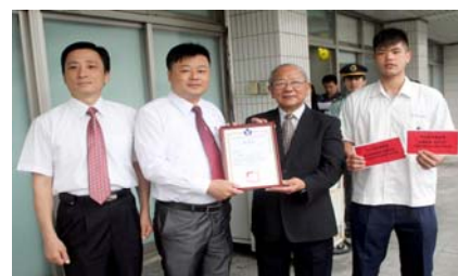
感謝林口教育基金會 致贈本校籃球隊獎助金