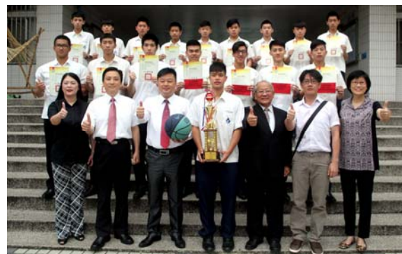
籃球隊榮獲 104 學年度 全國高中籃球乙級聯賽季軍