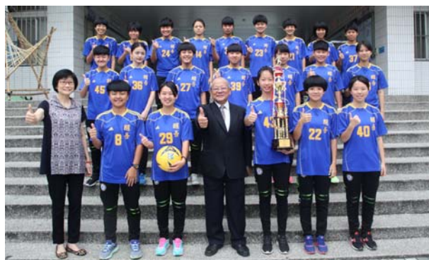
高中部女子足球隊榮獲 104 學年度 中等學校 11 人制足球聯賽「甲級」冠軍