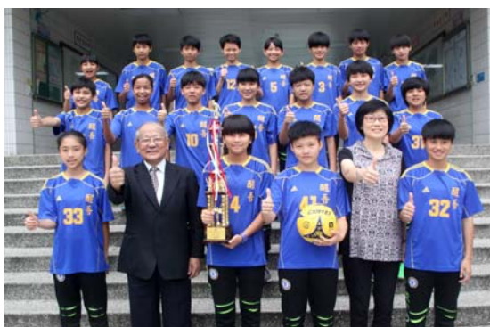
國中部女子足球隊榮獲 104 學年度 中等學校 11 人制足球聯賽「甲級」亞軍