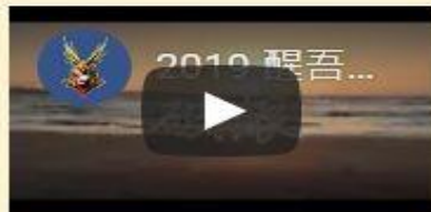
醒中2019畢業紀念微電影