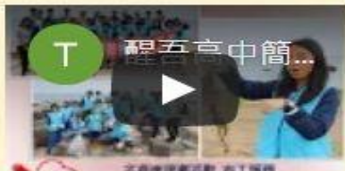
醒吾高中介紹影片