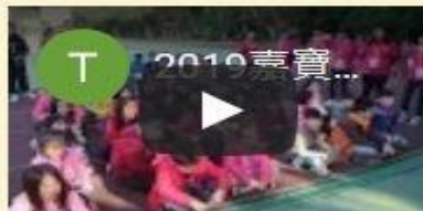
2019嘉寶國小資訊素養營